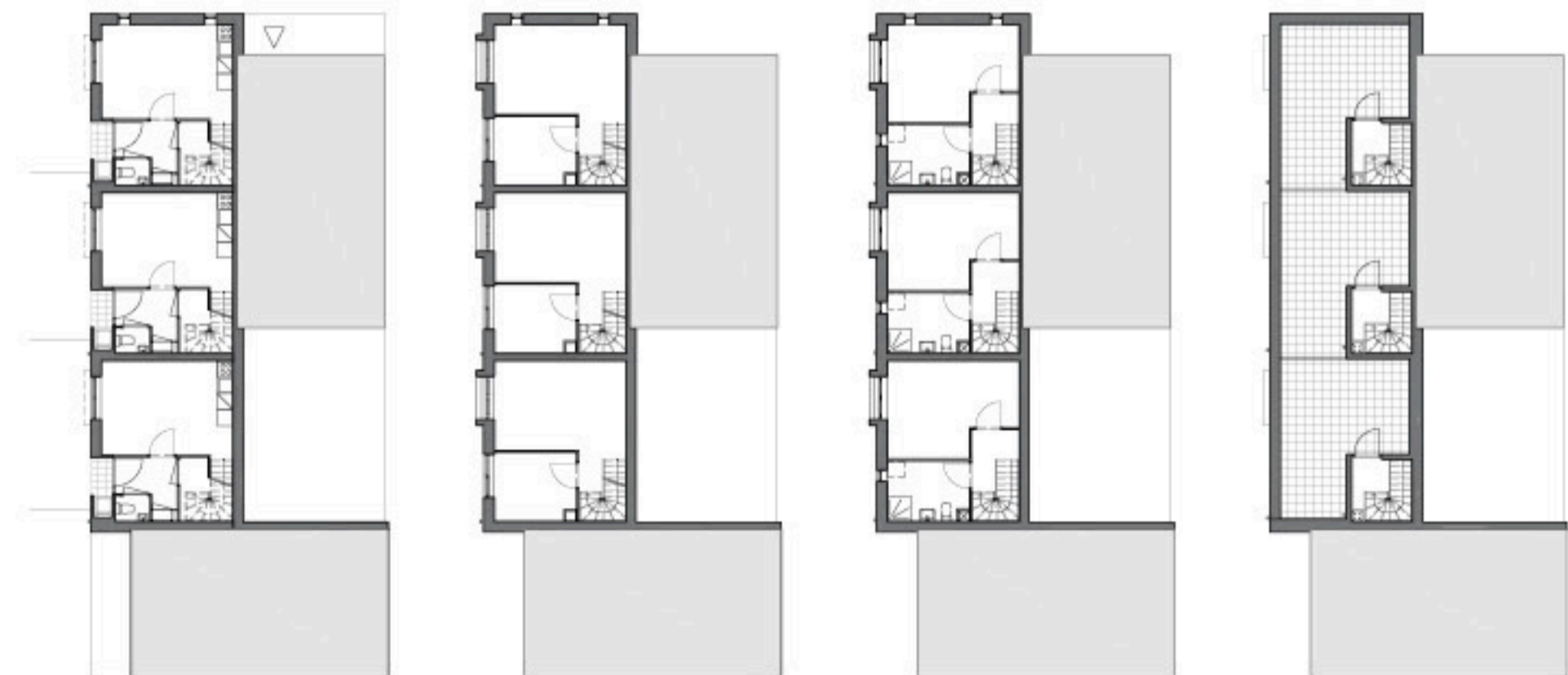
woningen met plat dak, begane grond / eerste verdieping / tweede verdieping / dakterras